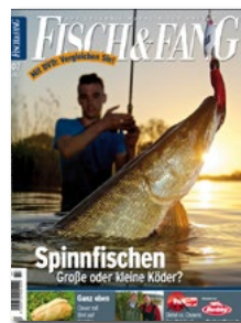
Titel: Hecht am Band

Legende ▶ Titelthema 🎬 Filme auf der DVD