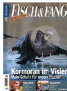
Titel: Kormoran im Visier